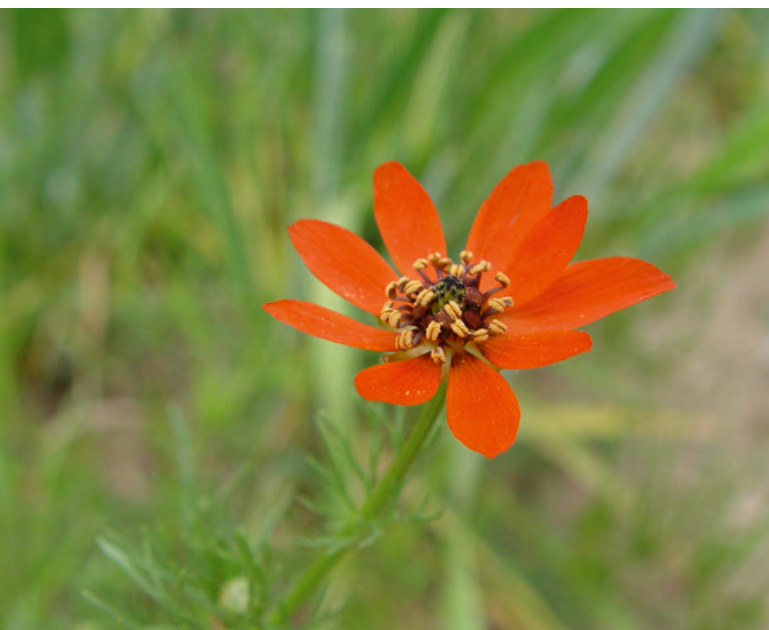
■ L'Adonis couleur de feu ( Adonis vernalis ), une espèce "Quasi menacée" et en déclin

L'état des lieux mené dans le cadre de la Liste rouge nationale a porté sur l'ensemble de la flore vasculaire du territoire métropolitain, afin de mesurer le degré de menace pesant sur chacune des espèces et sous-espèces.